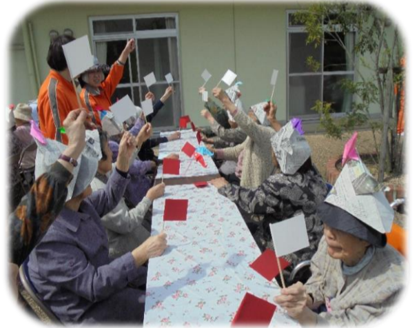
▲赤上げて、白上げた旗揚げゲーム

五月晴れの下、端午の節句を開催しました。目の前を元気に泳ぐ園庭の鯉のぼりをご覧になり、利用者さんも「色々な鯉がたくさんいるね」と感動されていました。暖かく、陽気に吹く風に舞い上がるたくさんの鯉のぼりを見ながら、「♪屋根よりたかーい こいのぼーりー♪」と、参加者全員で大合唱しました。手や身体を使った体操の後、職員手作りの水ようかんを召し上がりました。旗揚げゲームでは、職員の「赤上げて、白下げて」などの掛け声に、スピードが速くなるにつれ、あちらこちらで、「間違えたー」「ひかかったー」と、大きい笑い声で会場は盛大に盛り上がりました。