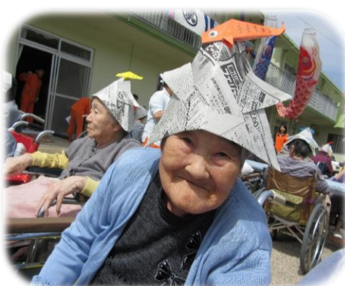
▲兜がお似合いです