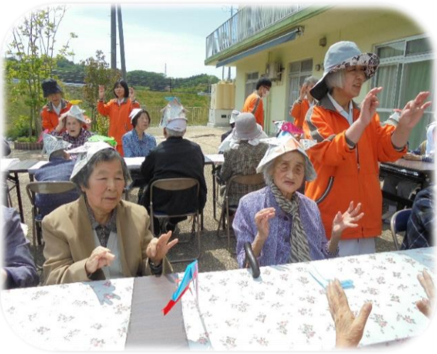
▲「ふるさと」の曲に合わせて指折り