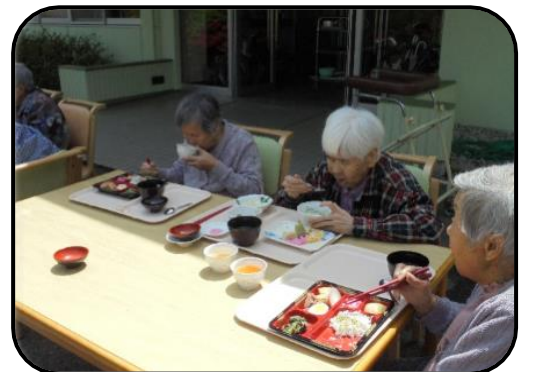
▲「こりゃ美味しいと大好評」