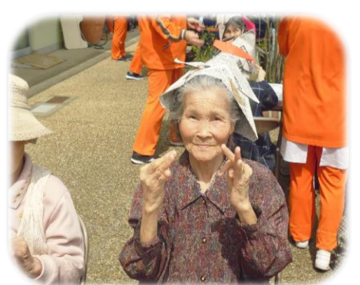
▲笑顔で指折り体操