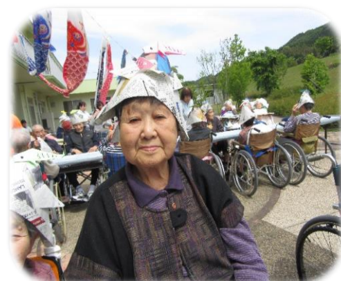
▲ちょっと緊張してます