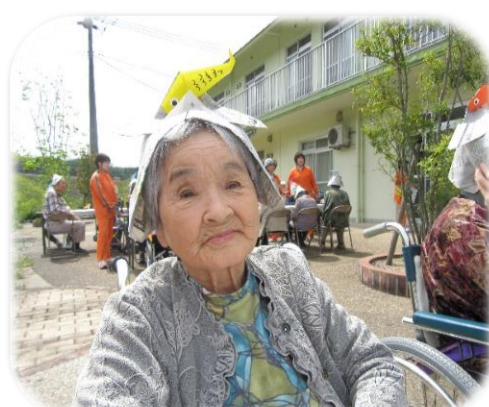
▲ちょっとおすまし