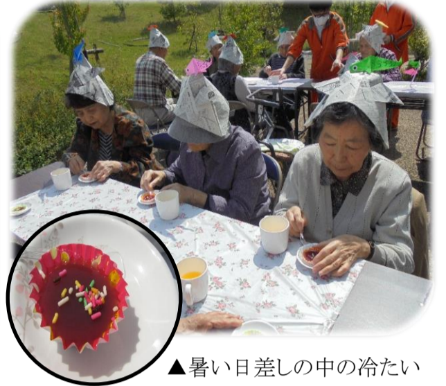
▲暑い日差しの中の冷たい水ようかん