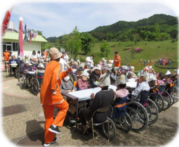
▲腕を振って足を上げて365歩のマーチ

五月晴れの下、端午の節句を開催しました。目の前を元気に泳ぐ園庭の鯉のぼりをご覧になり、利用者さんも「色々な鯉がたくさんいるね」と感動されていました。暖かく、陽気に吹く風に舞い上がるたくさんの鯉のぼりを見ながら、「♪屋根よりたかーい こいのぼーりー♪」と、参加者全員で大合唱しました。手や身体を使った体操の後、職員手作りの水ようかんを召し上がりました。旗揚げゲームでは、職員の「赤上げて、白下げて」などの掛け声に、スピードが速くなるにつれ、あちらこちらで、「間違えたー」「ひかかったー」と、大きい笑い声で会場は盛大に盛り上がりました。