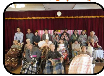
▲4月生まれの利用者さんとご家族 ▲5月生まれの利用者さんとご家族