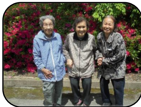
▲つつじの前で記念撮影